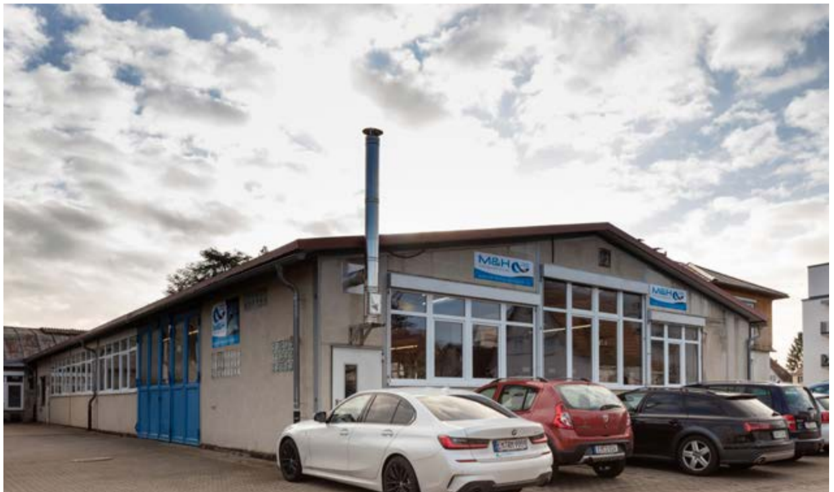
Der Produktionsstandort in Kenzingen